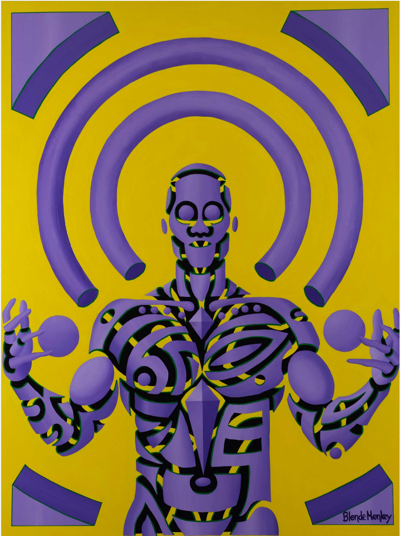
BLONDEMONKEY | Control, 2022, Acryl auf Leinwand, 120 x 160 cm | © BLONDEMONKEY